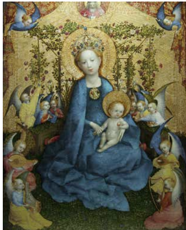
Stefan Lochner: Madonna im Rosenhag, 1450. Wallraf-Richartz-Museum Köln.

Den symbolske tilgang i den analytiske psykologi bliver særdeles vigtig, når det kommer til det kliniske arbejde med drømme. For Jung var det tydeligt, at det